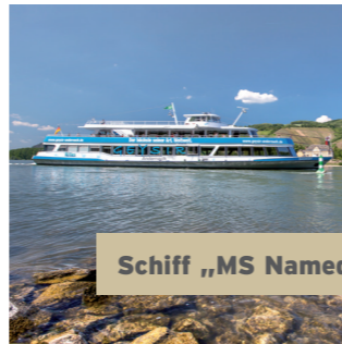
Schiff „MS Namedy“